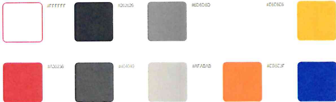
Таблицы и диаграммы